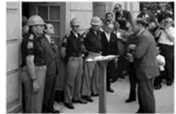
阿拉巴馬州長站在阿拉巴學校門口堅持種族隔離，與司法部部长對峙