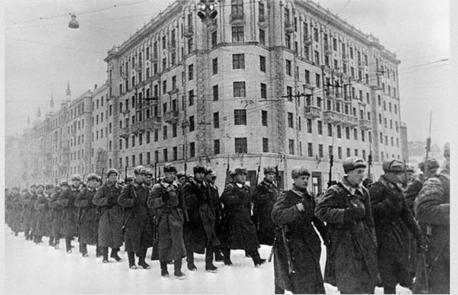
1941年12月從莫斯科奔赴前線作戰的蘇聯主力軍