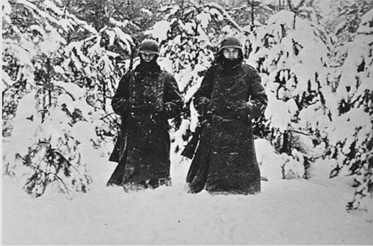
在莫斯科以西風雪中的德軍士兵