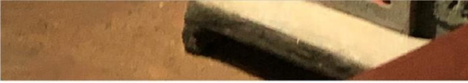
(古時候的農家人對土地公很虔誠)