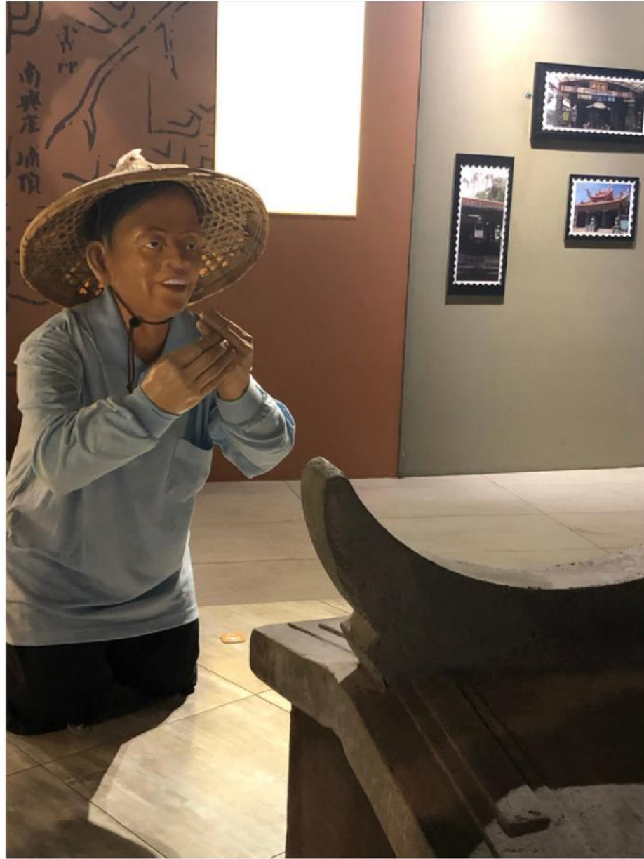
(插福金-土地公看管地防止別人進入)

平常不曾了解的知識，經過戶外學習瞭解更多漢人的文化。像是孔廟祭祀典禮每個人代表的職位或者是重前的人為何祭祀土地公