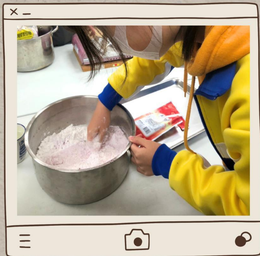
( 搓湯圓 )