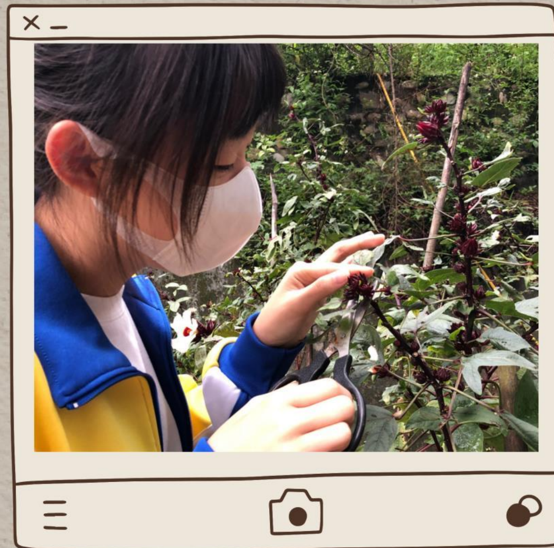
( 採洛神花 )