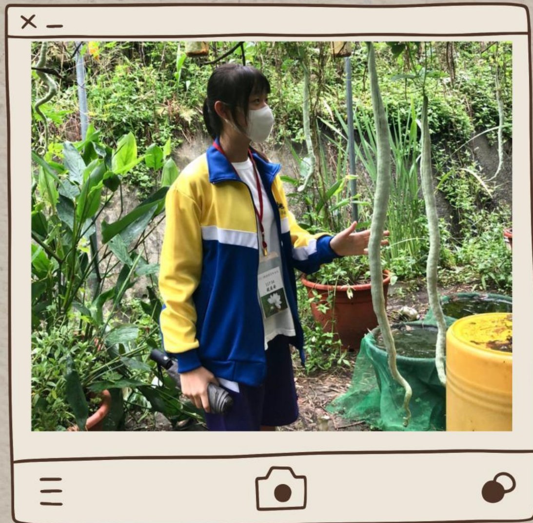
( 與蛇瓜見面 )