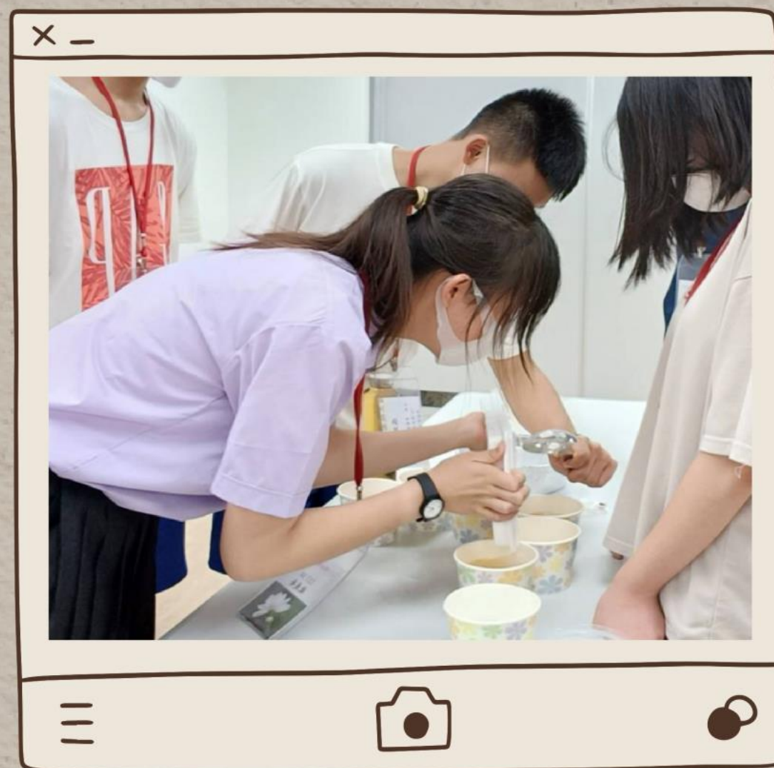
( 搓愛玉 )