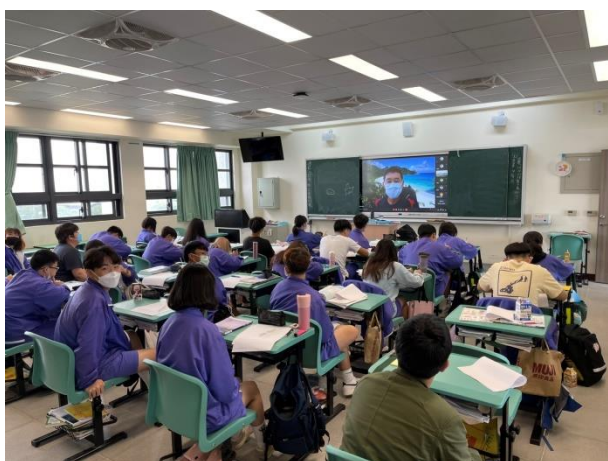
各班級線上觀看情形