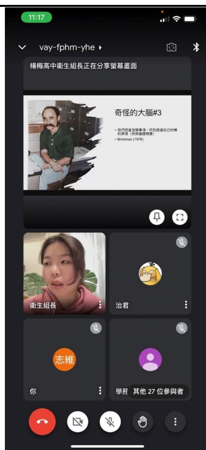
講師線上直播講解