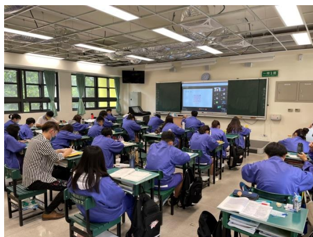
各班級線上觀看情形